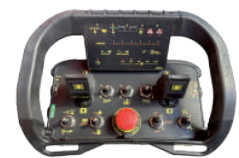
Radio console by AUTECH